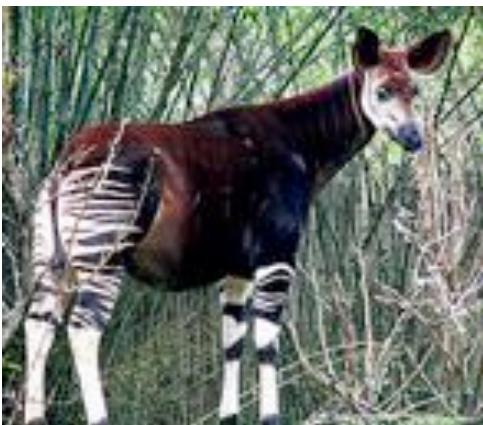
Pepijn Verscheure wordt Aarzelende Okapi