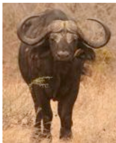
Jary De Bosscher wordt Goedlachse Buffel